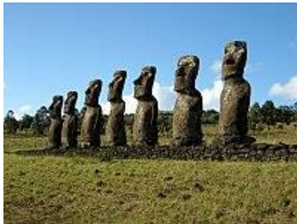
▲全島僅有一處面海的摩艾石像群。

大約在十世紀到十六或十七世紀的歲月裡，島民開始修建大量的巨型石像：摩艾（Moai），這些石像與島民的宗教與祭祀活動有著密切的關係。像這樣的石像一共製造 900 多個，它們每一個都高 7-10 公尺，重量從 20 噸到 90 噸，最重的竟然達 200 噸。根據研究推測，島上有火山噴發形成的凝灰岩與火山岩，島民們用玄武岩製成的斧頭加工而成，再用哈兀哈兀樹纖維製成的繩索，以及棕櫚樹製成的木橇杆，把石像運送到全島各地並豎立起來。