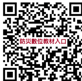
防災數位教材入口

本計畫所開發之防災數位教材已公開，目前開發災害類型包含「地震災害」及「地質災害」，歡迎掃描右方 QR code 或下列網址免費取用： https://linktr.ee/dmoetw01