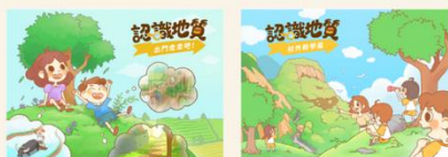
第一本「出門走走吧」 第二本「戶外教學篇」

開發 4 本 AR 繪本「地震來了！」，提供 AR 技術進行地質災害境況模擬技術，享受立體視覺浸淫體驗，以建立學生面對災害時的思維能力與判斷能力，進一步深化防災知識技能。