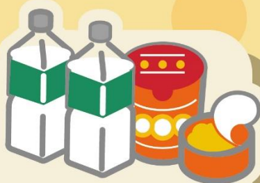
準備3日份 食物飲水