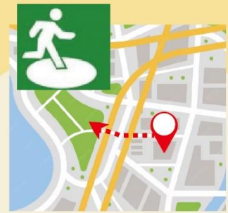
查詢居家避難 路線及避難收容所