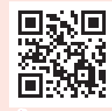
คำชี้แจงกิจกรรมจับรางวัล

คู่มือปกรางวัลอิเล็กทรอนิกส์หรือชุดตรวจจากโครงการอื่น เนื่องจากเป็นการแจกฟรี ดังนั้นหลังจากบันทึกผลการตรวจแล้วจะ ไม่แจกคู่มือปกรางวัลให้อีก สามารถเข้าร่วมเฉพาะกิจกรรมจับรางวัลเท่านั้น