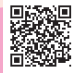
วิธีการตรวจคัดกรองและการให้บริการ

ชุดตรวจเอชไอวีด้วยตนเองจะเป็นการตรวจแอนติบอดีของเชื้อเอชไอวี ต้องตรวจหลังจาก ติดเชื้อเอชไอวี 23-90 วัน (ประมาณ 4-12 สัปดาห์) จึงสามารถตรวจสอบว่าติดเชื้อหรือไม่