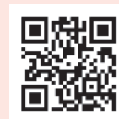
About PrEP by Taiwan Centers for Disease Control