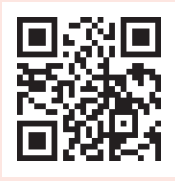
ข้อมูลสรุป PrEP

PrEP เป็นยาประเภทป้องกันล่วงหน้าที่จะช่วย ระหว่างประเทศยืนยันว่ามีประสิทธิภาพใน การป้องกันเชื้อเอชไอวี ก่อนใช้จะเมื่อตัดสินใจ เริ่มยาควรปรึกษาแพทย์ก่อน ดูข้อมูลละเอียด ได้ที่ข้อมูลของลิงก์ QR code