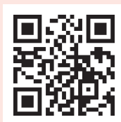
PrEP for dummies

PrEP is a medication proven to be effective for preventing HIV when taken following a physician's assessment. Please scan the QR-code for more information.