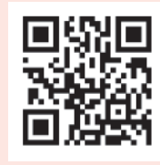
เว็บไซต์โครงการ PrEP